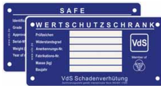
Bild 1: Anerkennungsplakette für einen Wertschutzschrank (Beispiel)

Die einbruchhemmenden Eigenschaften von Wertbehältnissen werden durch das Prüf- und Anerkennungsverfahren von VdS Schadenverhütung objektiv ermittelt und mit dem VdS-Zertifikat bestätigt. Eine gleichbleibend hohe Qualität der gefertigten Produkte muss während des gesamten Gültigkeitszeitraums des VdS-Zertifikats gewährleistet werden. Hierzu weist die Fertigungsstätte des Anerkennungsinhabers ein zertifiziertes Qualitätsmanagementsystem nach DIN EN ISO 9001 nach. Darüber hinaus werden die Fertigungsstätte und der Herstellungsprozess in regelmäßigen Zeitabständen überwacht.