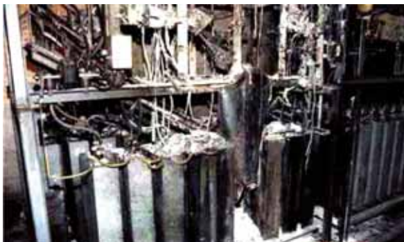
Brand in einer Kompensationsanlage